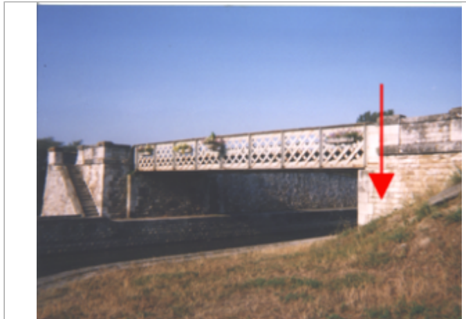
Vue du site BDHE 123 point de repère 162

Coordonnées WGS84 : X: 1.96242598 / Y: 47.90316650