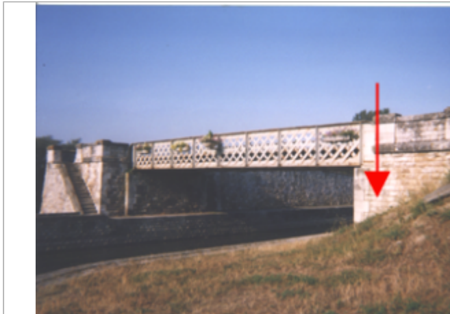
Vue du site BDHE 123 point de repère 162

Coordonnées WGS84 : X: 1.96242598 / Y: 47.90316650