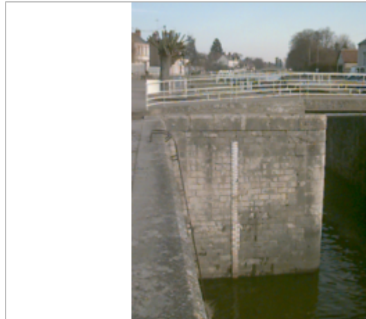
Vue du site BDHE 119 point de repère 157

Coordonnées WGS84 : X: 1.98467245 / Y: 47.89895080