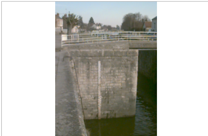
Vue du site BDHE 119 point de repère 157