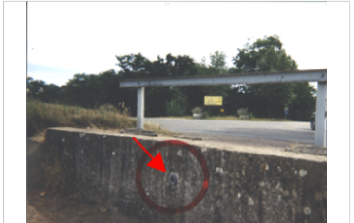
Vue du site BDHE 118 point de repère 154

Coordonnées WGS84 : X: 1.99461733 / Y: 47.89044100