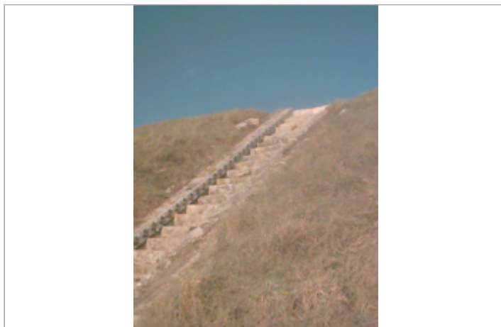
Vue du site BDHE 117 point de repère 153

Coordonnées WGS84 : X: 2.02978151 / Y: 47.88330250