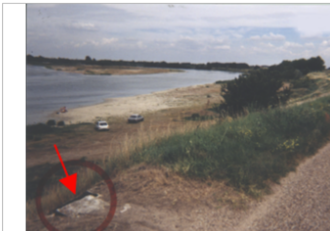
Vue du site BDHE 116 point de repère 152

Coordonnées WGS84 : X: 2.03486572 / Y: 47.85459680