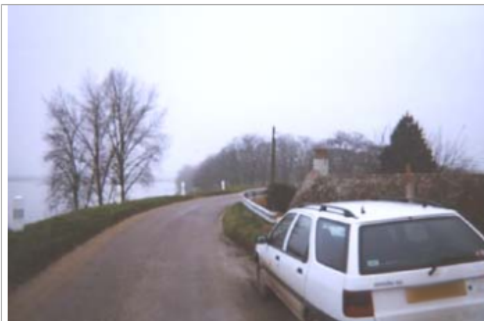
Vue du site BDHE 115 point de repère 151

Coordonnées WGS84 : X: 2.05372099 / Y: 47.86287790