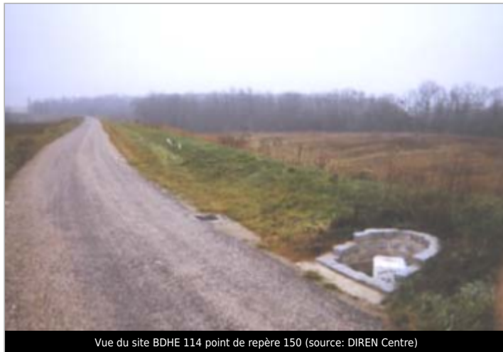
Vue du site BDHE 114 point de repère 150

Coordonnées WGS84 : X: 2.08455292 / Y: 47.87279800