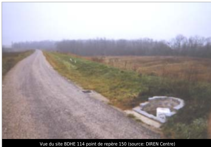
Vue du site BDHE 114 point de repère 150

Coordonnées WGS84 : X: 2.08455292 / Y: 47.87279800