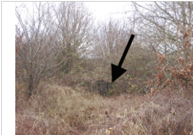
Vue du site BDHE 113 point de repère 149

Coordonnées WGS84 : X: 2.08420515 / Y: 47.87279530