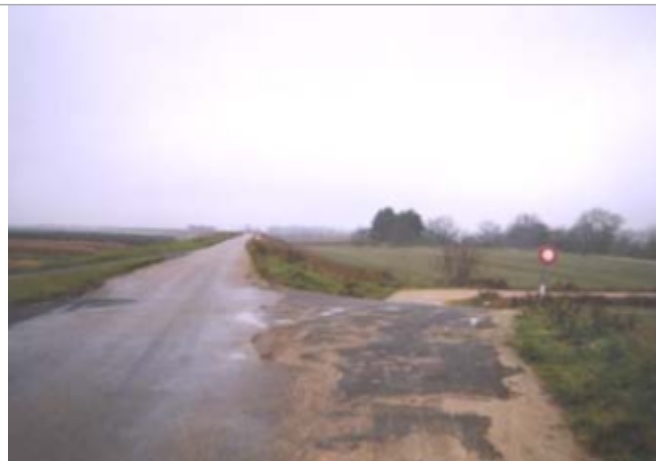
Vue du site BDHE 112 point de repère 148

Coordonnées WGS84 : X: 2.09980373 / Y: 47.87038680