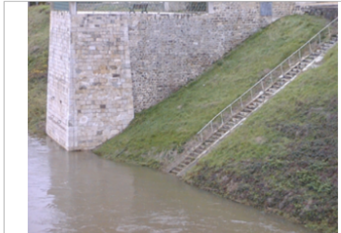
Vue du site BDHE 111 point de repère 419

Coordonnées WGS84 : X: 2.12530086 / Y: 47.87030960