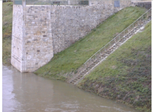
Vue du site BDHE 111 point de repère 419

Coordonnées WGS84 : X: 2.12530086 / Y: 47.87030960