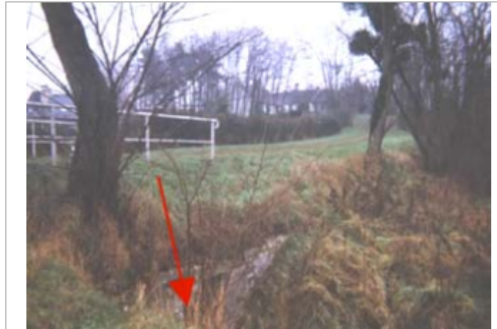
Vue du site BDHE 110 point de repère 146

Coordonnées WGS84 : X: 2.14536001 / Y: 47.86234810