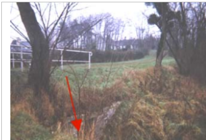
Vue du site BDHE 110 point de repère 146