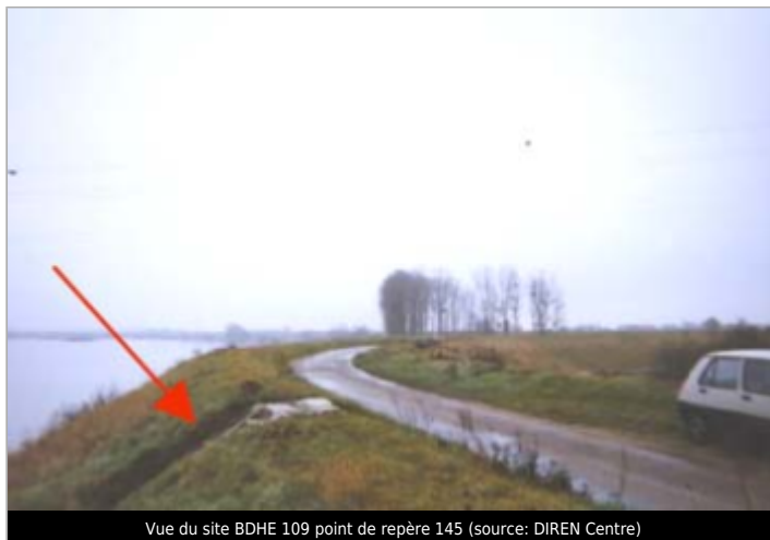
Vue du site BDHE 109 point de repère 145