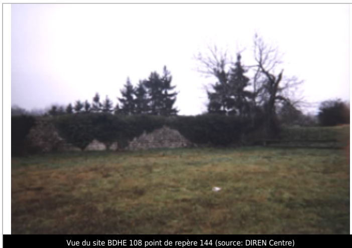
Vue du site BDHE 108 point de repère 144