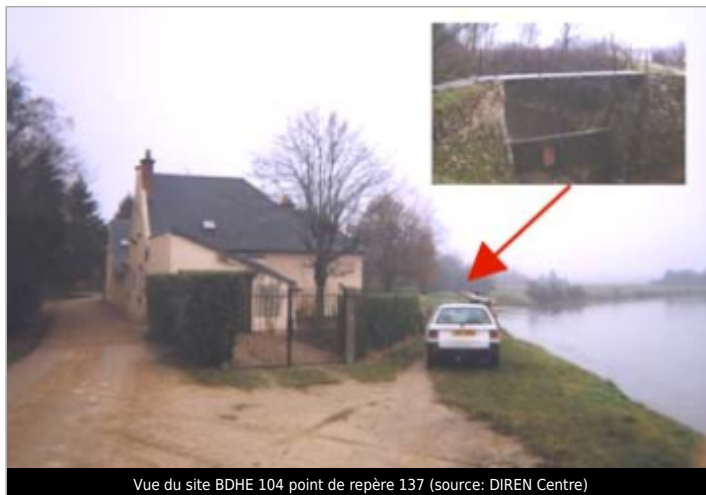
Vue du site BDHE 104 point de repère 137