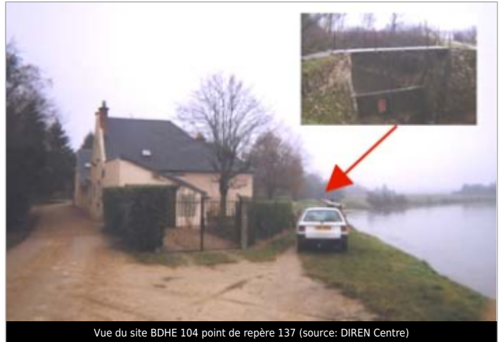
Vue du site BDHE 104 point de repère 137

Coordonnées WGS84 : X: 2.24090314 / Y: 47.85701090