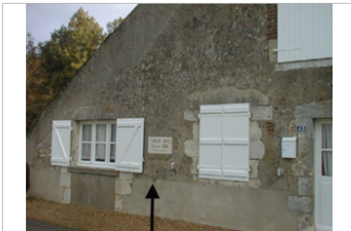
Vue du site BDHE 99 point de repère 132