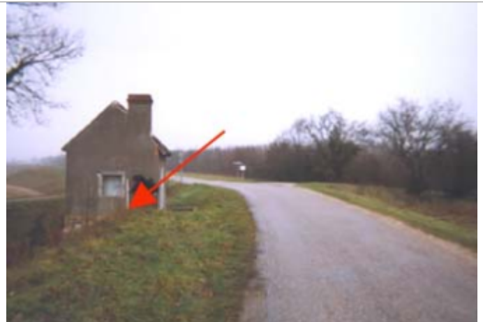
Vue du site BDHE 98 point de repère 131

Coordonnées WGS84 : X: 2.28563250 / Y: 47.80453150