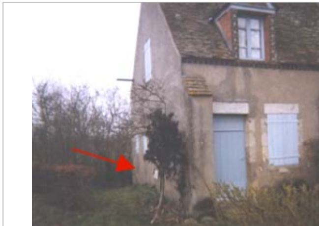
Vue du site BDHE 95 point de repère 126

Coordonnées WGS84 : X: 2.32637480 / Y: 47.78909380