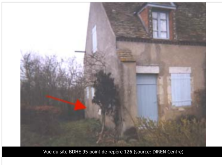
Vue du site BDHE 95 point de repère 126