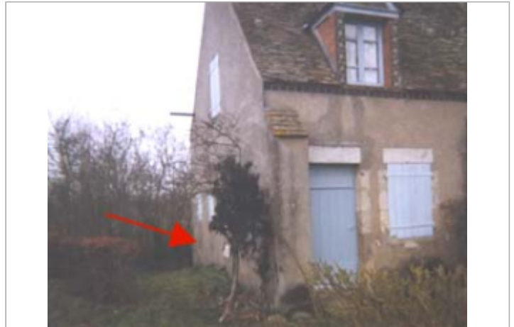
Vue du site BDHE 95 point de repère 126