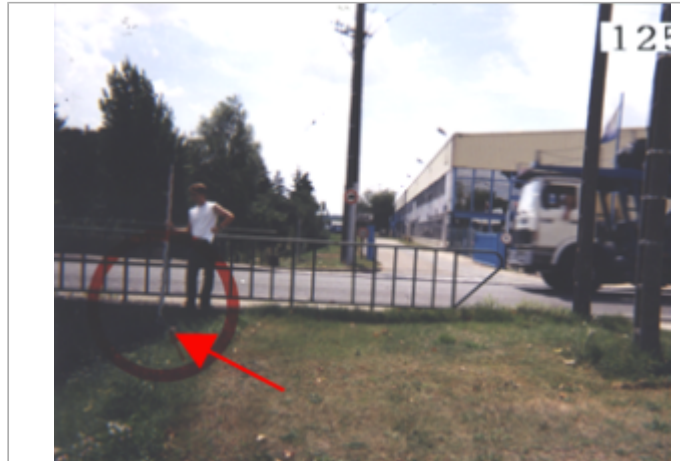
Vue du site BDHE 94 point de repère 125

Coordonnées WGS84 : X: 2.35157075 / Y: 47.76660850