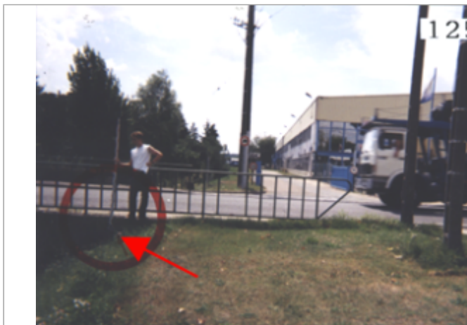
Vue du site BDHE 94 point de repère 125