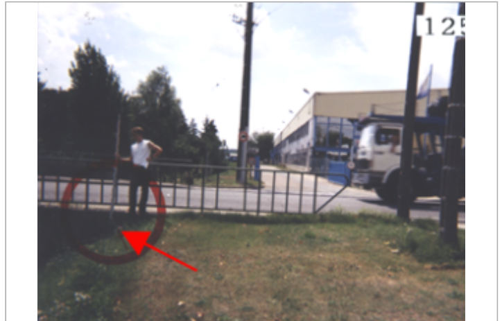
Vue du site BDHE 94 point de repère 125