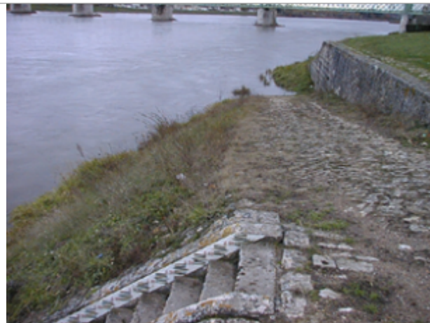
Vue du site BDHE 93 point de repère 124

Coordonnées WGS84 : X: 2.37176660 / Y: 47.77138090