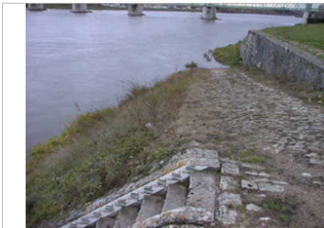
Vue du site BDHE 93 point de repère 124