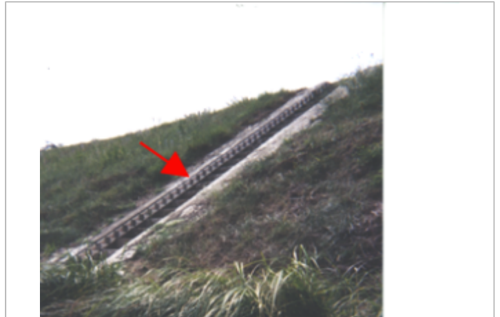
Vue du site BDHE 92 point de repère 123

Coordonnées WGS84 : X: 2.37268131 / Y: 47.77193480