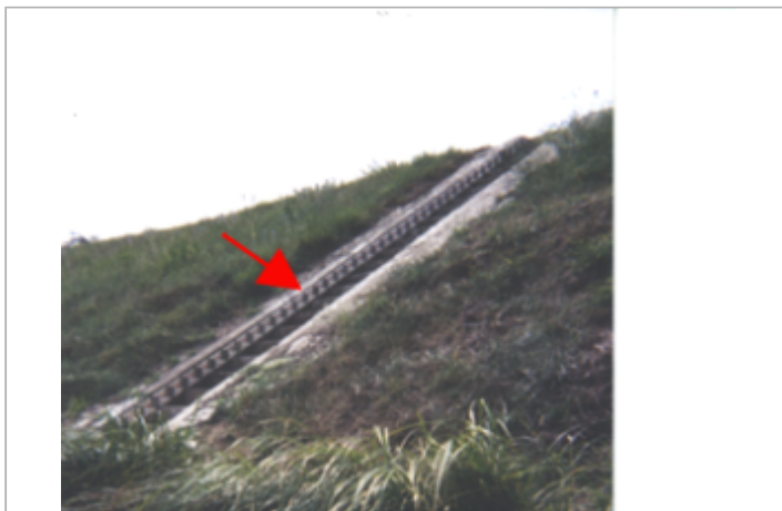
Vue du site BDHE 92 point de repère 123