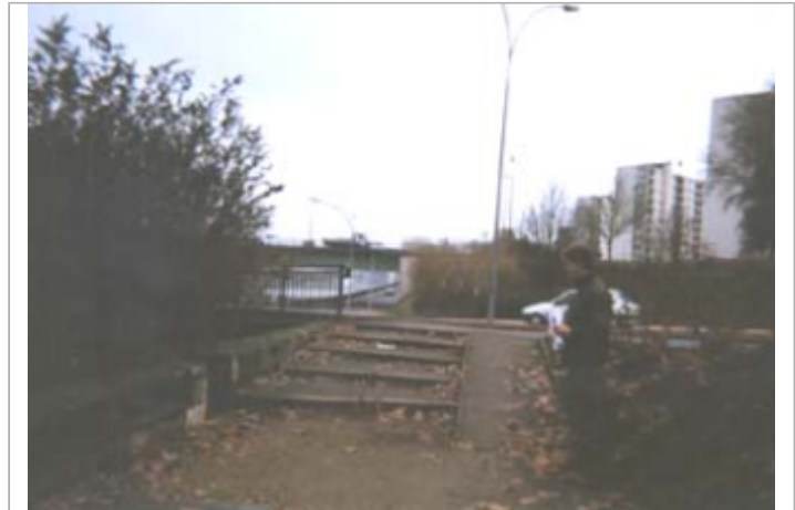
Vue du site BDHE 143 point de repère 188

Coordonnées WGS84 : X: 1.89455802 / Y: 47.89503180