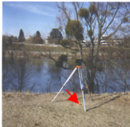
Vue du site BDHE 125 point de repère 561