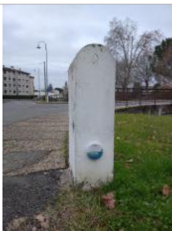
Vue du repère - Auteur : SMBGP

Altitude calculée de l'eau (en m) : 183.819 m