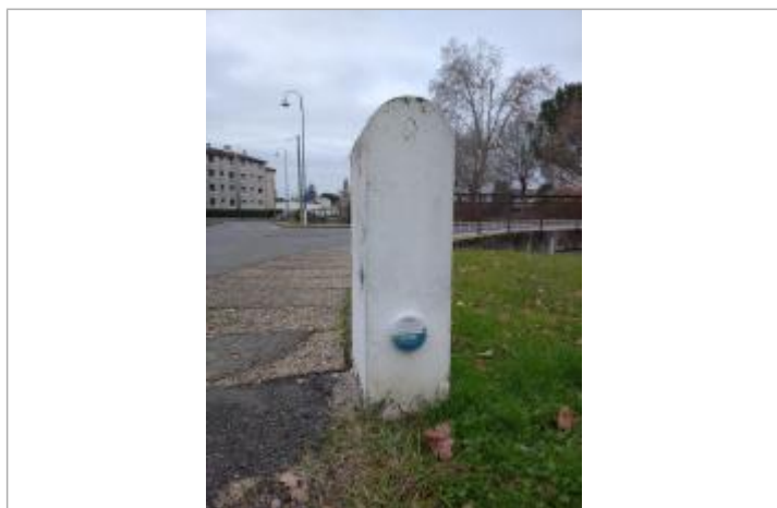
Vue du repère - Auteur : SMBGP