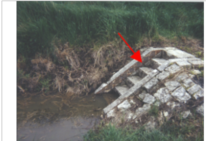
Vue du site BDHE 71 point de repère 95

Coordonnées WGS84 : X: 2.68614468 / Y: 47.66066780