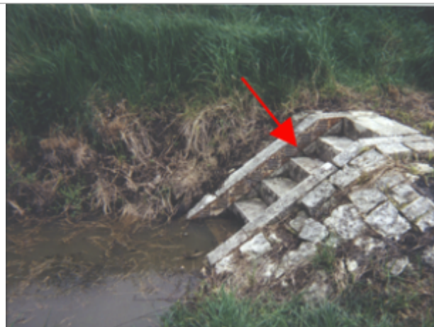
Vue du site BDHE 71 point de repère 95

Coordonnées WGS84 : X: 2.68614468 / Y: 47.66066780