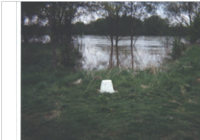
Vue du site BDHE 70 point de repère 94