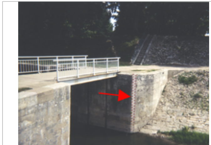
Vue du site BDHE 69 point de repère 93

Coordonnées WGS84 : X: 2.72877059 / Y: 47.63877610