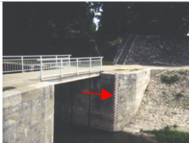
Vue du site BDHE 69 point de repère 93