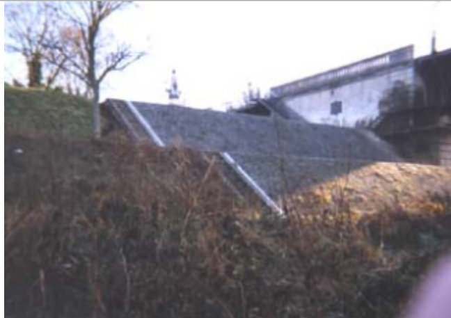
Vue du site BDHE 68 point de repère 91.