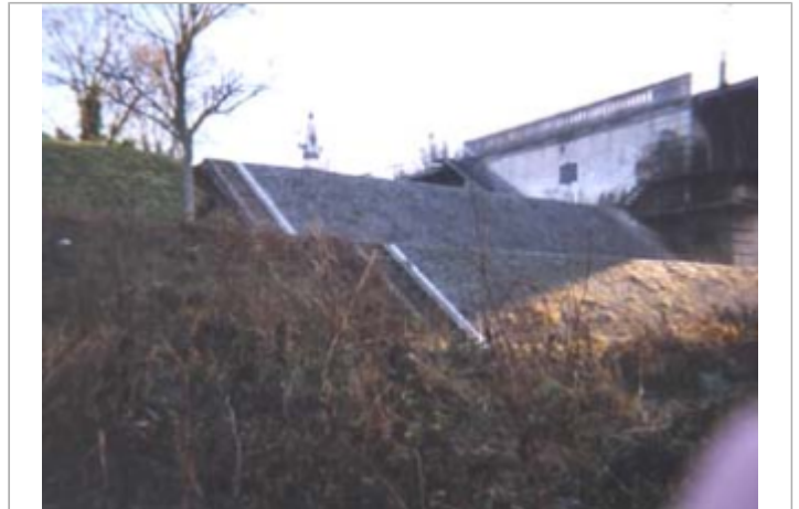
Vue du site BDHE 68 point de repère 91.