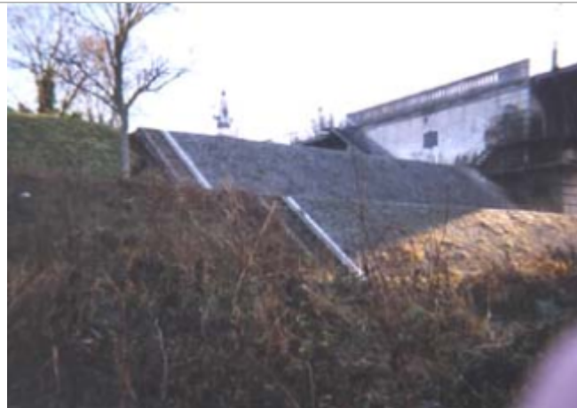
Vue du site BDHE 68 point de repère 91.