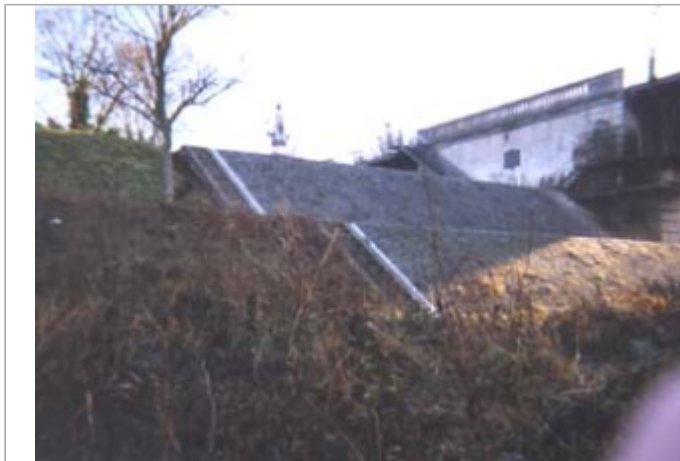
Vue du site BDHE 68 point de repère 91.