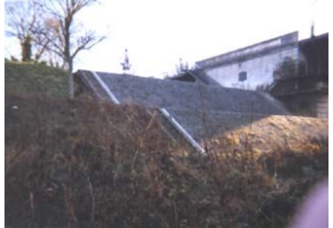
Vue du site BDHE 68 point de repère 91.