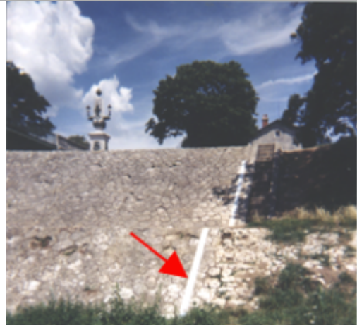
Vue du site BDHE 67 point de repère 89