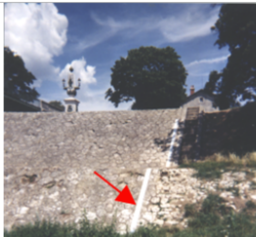
Vue du site BDHE 67 point de repère 89

Coordonnées WGS84 : X: 2.73781994 / Y: 47.63201890