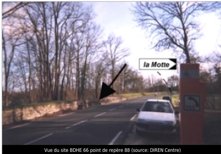
Vue du site BDHE 66 point de repère 88