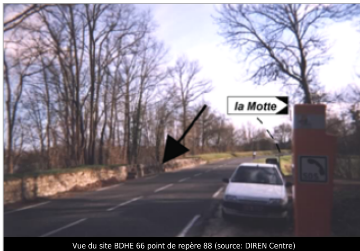
Vue du site BDHE 66 point de repère 88